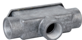
Tipo B Coperchio pressofuso Type B Die-cast cover